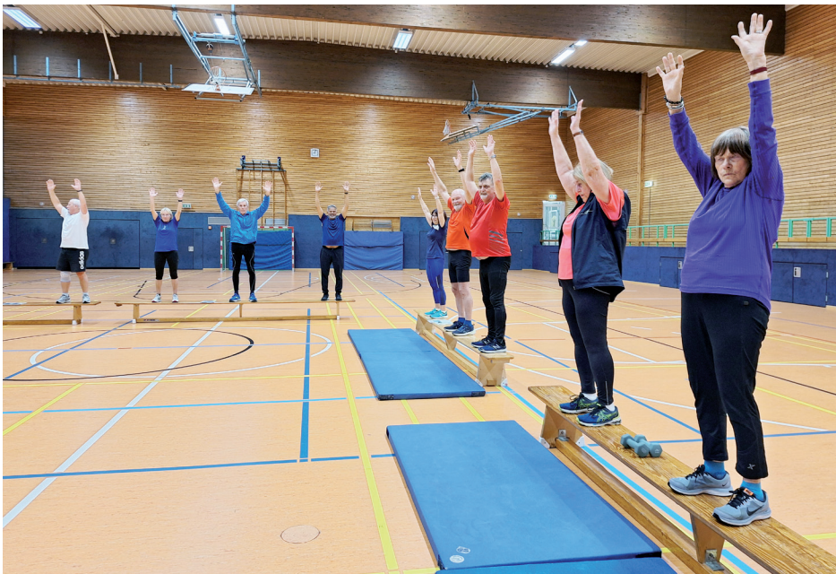
Die Leichtathletik-Senioren beim abwechslungsreichen Training in der Halle

Die Gruppe der Leichtathletik-Senioren gibt es seit nahezu 50 Jahren. Damit sie auch weiterhin bestehen bleibt, freuen wir uns immer wieder, wenn jüngere Leute (ü. 50) den Weg zu uns finden.