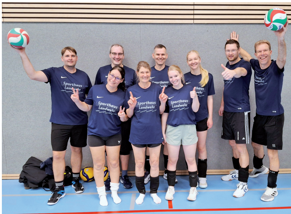
Die „Wild Ducks“ beim Hobby-Mixed-Turnier in Glinde haben klare Ziele

Keine Verletzungen, Spaß haben und nicht Letzter werden.