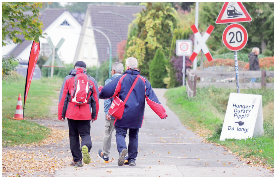
Kurz vorm Verpflegungspunkt beim Tennisclub Havighorst

Start-Ziel wird im Barsbütteler Ortsteil Stellau sein und als Zielgebiet ist das Naturschutzgebiet Höltingbaum geplant.