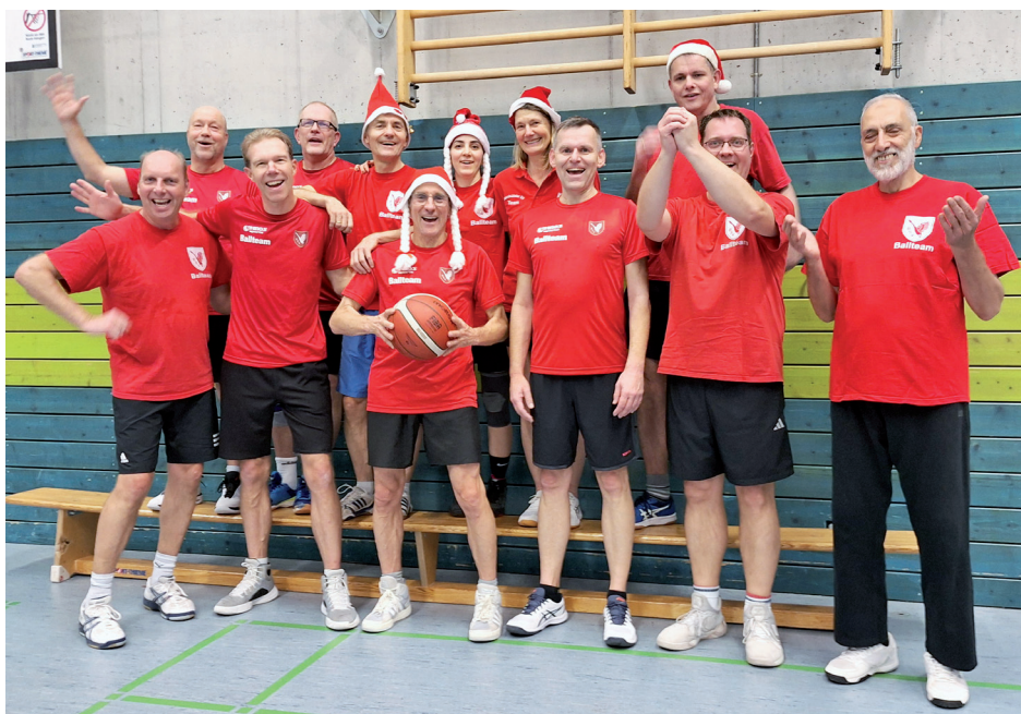
Das Ballteam beim Weihnachtstraining 2025 in der EKG-Sporthalle

Es war Mittwoch, der 1. Februar 2006 – die Geburt unserer Sportgruppe.