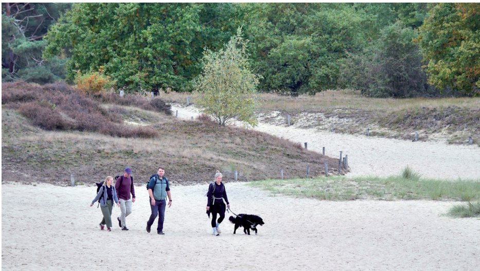
Die Teilnehmer/innen der 30 km langen Strecke auf der großen Boberger Düne

Der geliehene Anhänger der Gemeinde Barsbüttel war randvoll gepackt und der 3. Barsbütteler Wandertag startete am 11. Oktober 2025 mit dem Aufbau des Start-Zielbereichs am Sportplatz in Willinghusen. An dieser Stelle direkt einmal herzlichen Dank an den Willinghusener SC für die Unterstützung! Die ersten Wanderfans starteten gemeinsam um 8 Uhr, um dann die 30 km lange Strecke mittels Navigation per Smartphone zu erkunden. Denn eine Beschilderung gibt es bei diesem Event nicht. Für die erfahrenen Wanderer ist das aber kein Problem, und selbst die große Sandfläche der Boberger Dünen wurde zielsicher überquert.