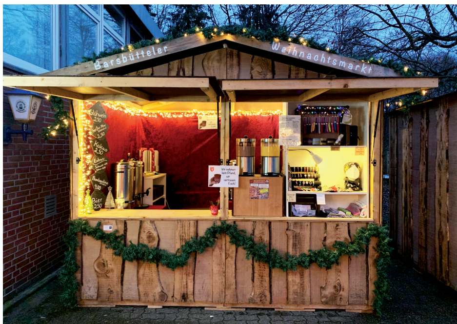
Die drei Holzhütten des Barsbütteler Weihnachtsmarktes gibt es nicht mehr

Mit insgesamt acht Personen wurden die drei Holzhütten Ende November aufgebaut. Mit viel Geduld (und noch mehr Holzklötzchen) müssen die Bodenplatten in Waage gebracht werden, damit die Einzelteile der Hütte dann auch passend miteinander verschraubt werden können und sich die Verkaufsklappen überhaupt öffnen lassen.