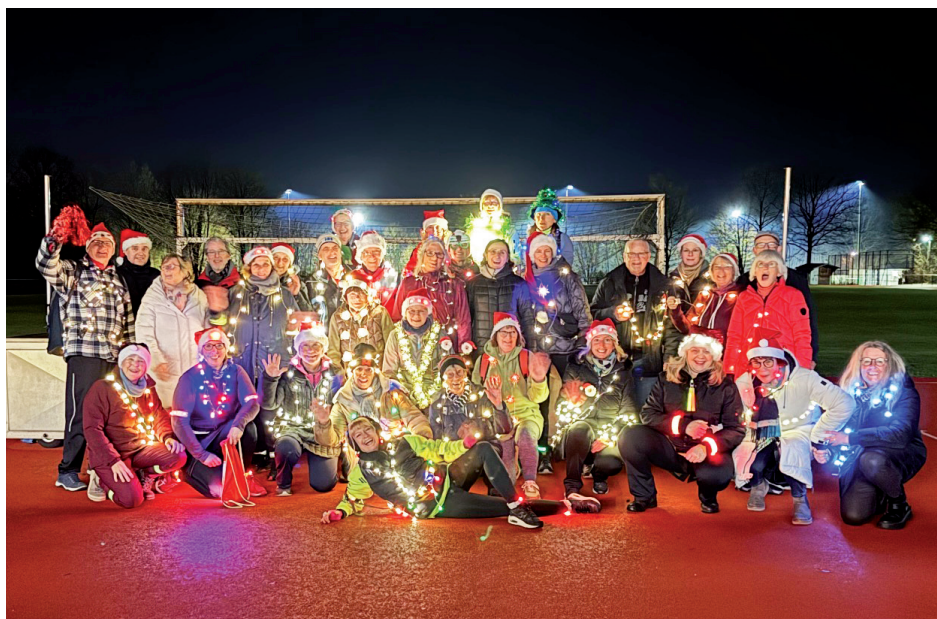
Sie strahlten um die Wette, die BSV Sportler bei der Weihnachtsparade 2025

Was war das für ein schönes Bild, als sich knapp 40 Sportler auf dem Parkplatz vor dem BSV Vereinsheim zum Start der Weihnachtsparade 2025 versammelten.