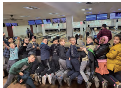
Jahresabschluss beim Bowling

Das letztjährige Abschlussevent führte die Kicker, Trainer und Betreuer der 1.E dann am 17.12.2024 ins Gilde Bowling Center nach Hamburg. Nach ein paar interessanten Matches und überhaupt nicht ruhigen Kugeln, bei denen der Spaß im Vordergrund stand, gab es einen kleinen Stadtgang durch Wandsbek und ein leckeres Mahl im Schweinske. Zum Abschluss bekamen alle Kids ein cooles Cap und einen leckeren Weihnachtsmann, bevor es per Trainer-/Betreuer Shuttle Service wieder gen Heimat ging.