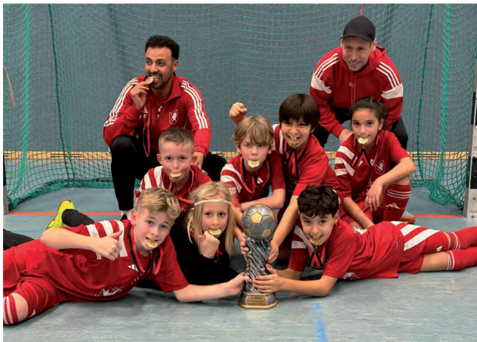
Das Team präsentiert stolz den gewonnenen Pokal und die Medaillen

Am 07. Dezember 2024 nahm Barsbüttels 1.E in der Turnhalle der Otto Hahn Schule am 5. Cordi WinterCup teil. In zwei Gruppen, mit je vier Teams wurde