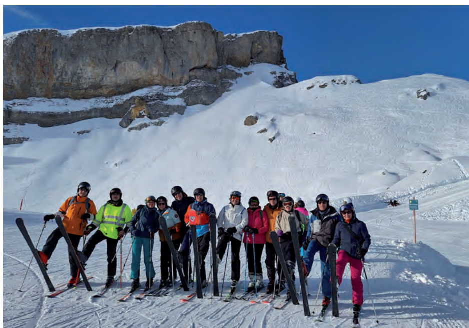
Das BSV Ski-Team vor dem „Ifen“ - Grenzbereich zu Österreich

Die Schneelage im Ort war in einer Höhe von 800 m ü. NN zwar recht dürrig, doch da die umliegenden Bergbahnen uns auf schneesichere Höhen brachten, fanden wir gute Pistenverhältnisse vor.